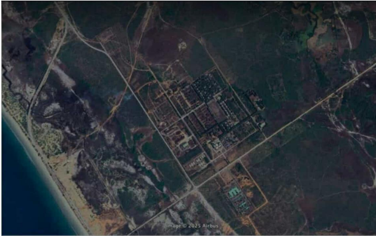
Photo: Satellite imagery of the stalled developments at the Dawei SEZ