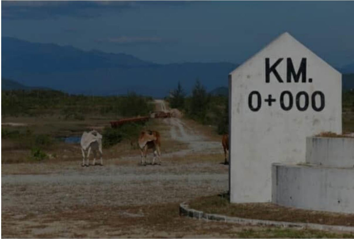
กิโลเมตรที่ 0 จุดเริ่มต้นโครงการเขตเศรษฐกิจพิเศษ